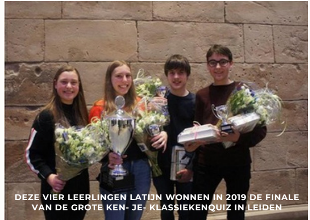
DEZE VIER LEERLINGEN LATIJN WONNEN IN 2019 DE FINALE VAN DE GROTE KEN- JE- KLASSIEKENQUIZ IN LEIDEN